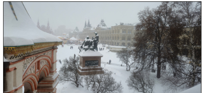
Der verschneite Rote Platz von der Basilius-Kathedrale aus gesehen.

vorbei am hell beleuchteten Bolschoi-Theater, dem Kreml und weihnächtlich geschmückten Strassen und Brücken. Am nächsten Morgen erklangen ein erstes Mal die Trycheln durch das Hotel als Begrüssung einer Gruppe von Moskowerinnen in ihren festlichen russischen Trachten. Sie begrüsst die Schweizer Reisegruppe ihrerseits mit einer traditionellen russischen Zeremonie: Sie boten Salz als Symbol der Genügsamkeit und des Friedens dar und luden dazu ein, das ebenfalls dargebotene Brot zu brechen und es mit Salz zu bestreuen, dies als Zeichen einer lebenslangen Freundschaft. Auch der gemeinsame Tanz nach Klängen russischer Volksmusik wirkte verbindend.