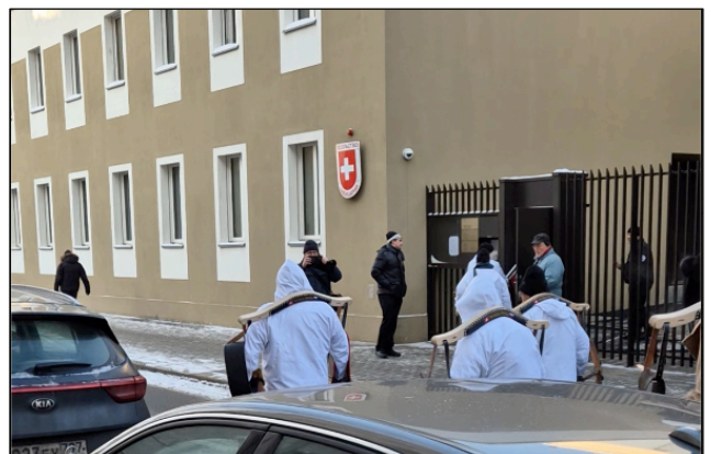
Die «Freundschaftstrychler» treffen vor der Schweizer Botschaft ein.

Am 26. Januar bot sich für die Reisegruppe aus der Schweiz die Gelegenheit, den Botschafter der Schweizerischen Eidgenossenschaft in Moskau, Jürg Burri, persönlich zu begrüssen. Wie 31 andere neu ernannte Botschafter hatte er am 15. Januar 2026 dem russischen Präsidenten Vladimir