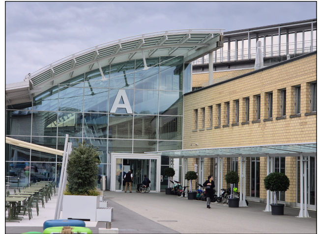
Eingang zur Aula des Paraplegiker-Zentrums, wo die Dankesfeier stattfand.

Vor 10 Jahren berichtete Dr. Zäch in einem Interview, er habe als 18-jähriger Bursche im Schwimmbad einen Kopfsprung in seichtes Wasser gemacht. Er habe Sterne gesehen und eine