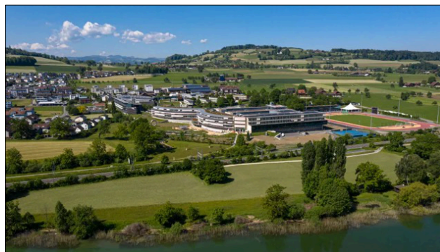
Luftaufnahme des Paraplegiker-Zentrums Nottwil LU.