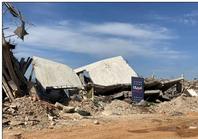
Ein von Israels IDF zerstörtes Haus in Kfar Kila im Süden Libanons. Auf dem Poster steht: «Amerika, die Mutter aller Kriege».

Unzählige Male sei Israel in den Libanon eingefallen und sie frage sich, ob die internationalen Medienvertreter wohl wüssten, was die israelischen Kinder in den Schulen über Libanon lernten? Sie lernten, «dass Libanon ein schönes Land mit herrlichen Wäldern» sei und dass sie es