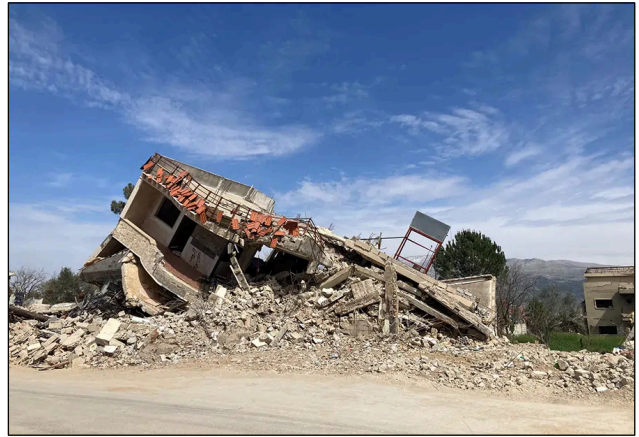
Man stelle sich das einmal vor: Die Armee eines Nachbarstaates warnt uns und zerbombt kurze Zeit darauf das Haus, in dem die eigene Familie seit Generationen gewohnt hat ... Israel tut das im südlichen Libanon (im Bild in Kham) – und die Welt schaut zu.

Die UN-Friedensmission für den Libanon, UNIFIL, wurde 1978 durch den UN-Sicherheitsrat ein-