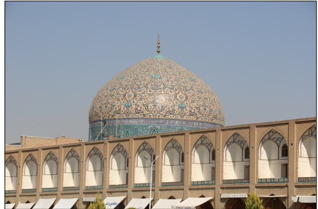
L'Iran et sa population ont besoin de paix. Mosquée de l'Imam à Isfahan.

des dynamiques régionales plus larges a peu de chances d'être durable.