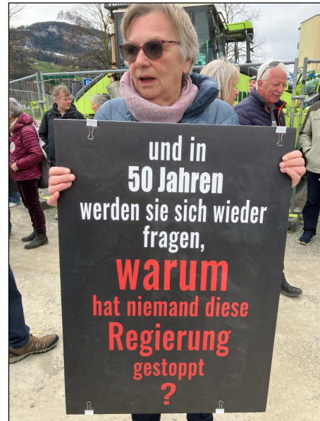
«Et dans 50 ans, ils se demanderont à nouveau: pourquoi personne n'a-t-il stoppé ce gouvernement?»

ni à Varsovie, ni à Rome – n'occupe la position de l'Allemagne, ni ne dispose du pouvoir que vous détenez personnellement pour mettre fin à cette catastrophe. Allez-vous tenter de rétablir la paix?