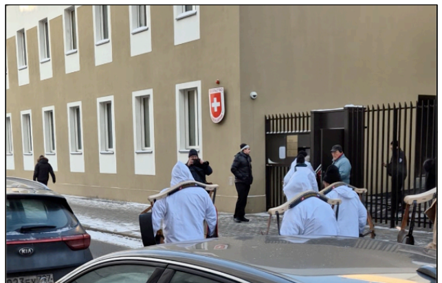
Les «Freundschaftstrychler» arrivent devant l'ambassade suisse.