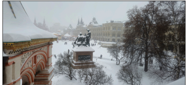
La Place Rouge enneigée vue depuis la cathédrale Saint-Basile.

Moscou, passant devant le théâtre Bolchoï illuminé, le Kremlin, les rues et ponts avec encore de nombreuses décorations de Noël. Le lendemain matin, les cloches ont retenti pour la première fois dans l'hôtel pour accueillir un groupe de femmes moscovites vêtues de leurs costumes traditionnels russes. Elles ont accueilli le groupe de voyageurs suisses avec une cérémonie traditionnelle russe: elles ont offert du sel, symbole de modestie et de paix, et les ont invités à rompre le pain qui leur était également offert et à le saupoudrer de sel, en signe d'amitié à vie. La danse commune au son de la musique folklorique russe a également contribué à créer des liens.