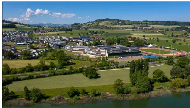
Vue aérienne du Centre des paraplégiques de Nottwil, Lucerne.

Avec ses 2240 employés, le Centre suisse des paraplégiques est aujourd'hui l'héritage vivant