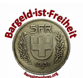
L'argent liquide empêche le contrôle total par l'Etat!

L'argent liquide est souvent présenté comme un facteur favorisant la criminalité, car il peut être utilisé de manière anonyme. Cependant, ce lien est largement surestimé. Si l'argent liquide joue un rôle dans les petites transactions illégales, il n'est pas adapté au blanchiment d'argent systématique. Les grosses sommes d'argent liquide sont difficiles à transporter, à stocker et à déplacer discrètement. C'est pourquoi les fonds illégaux sont introduits le plus rapidement possible dans le circuit financier numérique. Les banques, les structures d'entreprises et les virements in-